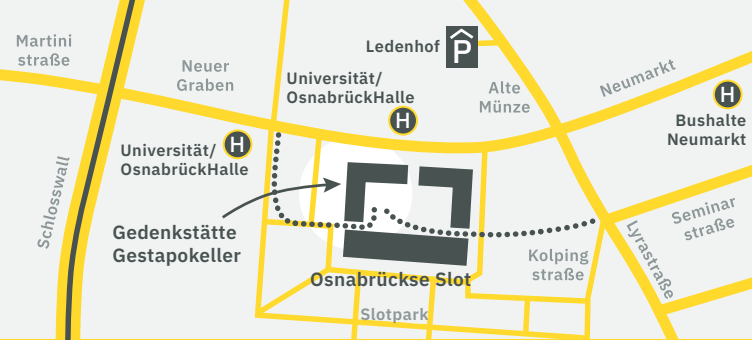
Route naar Herdenkingsplaats Gestapokeller