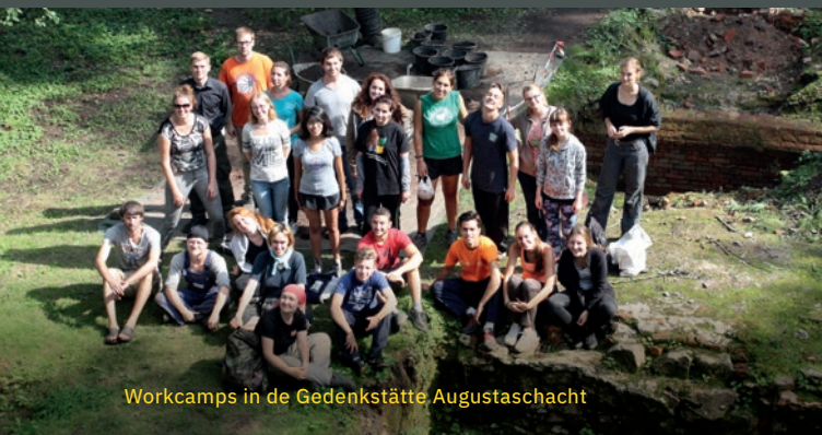
Workcamps in de Gedenkstätte Augustaschacht

In beide gedenk plaatsen zijn publicaties verkrijgbaar over de Gestapo Osnabrück, het AEL Ohrbeck en andere thema's van de tentoonstellingen.