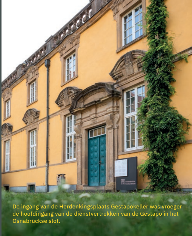
De ingang van de Herdenkingsplaats Gestapokeller was vroeger de hoofdingang van de dienstvertrekken van de Gestapo in het Osnabrückse slot.