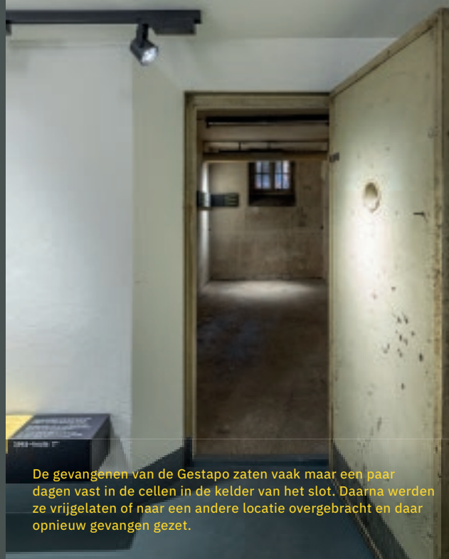
De gevangenen van de Gestapo zaten vaak maar een paar dagen vast in de cellen in de kelder van het slot. Daarna werden ze vrijgelaten of naar een andere locatie overgebracht en daar opnieuw gevangen gezet.

Bij de tentoonstelling, die uit twee delen bestaat, staat in de Herdenkingsplaats Gestapokeller de geschiedenis van de Gestapo Osnabrück centraal en in de Herdenkingsplaats Augustaschacht de geschiedenis van het werkopvoedingskamp Ohrbeck. De herdenkingsplaatsen kunnen afzonderlijk worden bezocht, in willekeurige volgorde.