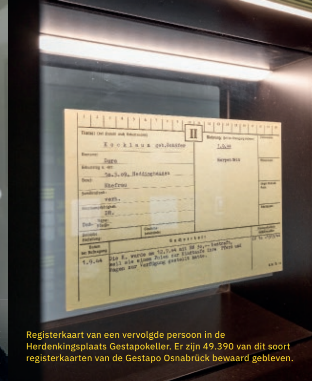
Registerkaart van een vervolgd persoon in de Herdenkingsplaats Gestapokeller. Er zijn 49.390 van dit soort registerkaarten van de Gestapo Osnabrück bewaard gebleven.