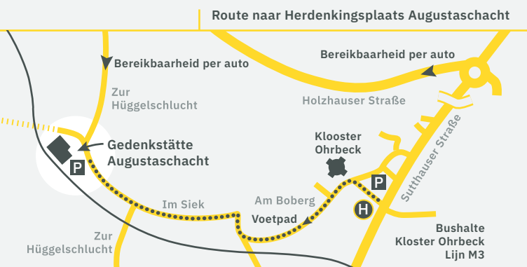
Route naar Herdenkingsplaats Augustaschacht