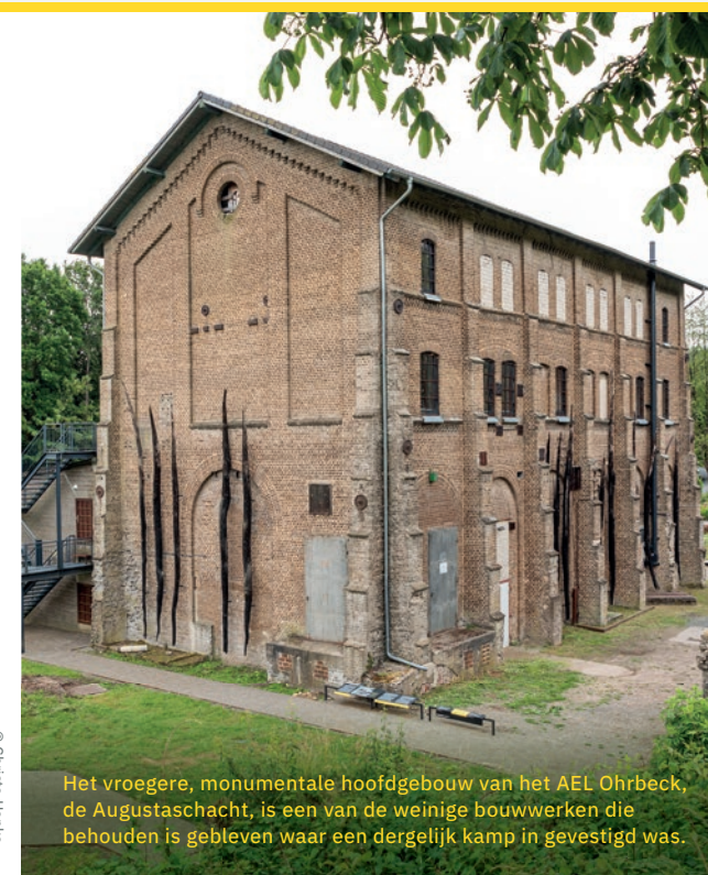
Het vroegere, monumentale hoofdgebouw van het AEL Ohrbeck, de Augustaschacht, is een van de weinige bouwwerken die behouden is gebleven waar een dergelijk kamp in gevestigd was.

AEL Ohrbeck werd opgericht en geëxploiteerd door de Gestapo in Osnabrück. Het AEL bestond van januari 1944 tot april 1945. Als locatie voor het werkopvoedingskamp koos de Gestapo Osnabrück de Augustaschacht. Het gebouw van het kamp behoorde toe aan de Klöcknerfabriek in Georgsmarienhütte, die samenwerkte met de Gestapo.